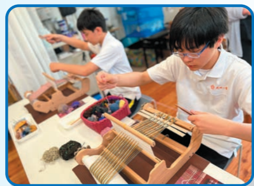
Loomsさんでホームスパン体験