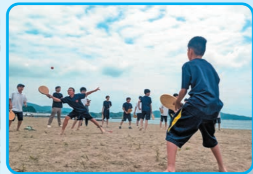
高田松原でフレスコボール