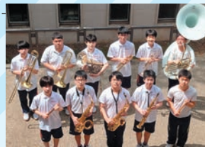
吹奏楽部 第47回全国高等学校 総合文化祭 マーチングバンド部門出場