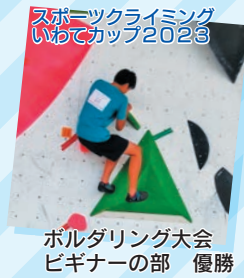
スポーツクライミング いわてカップ2023