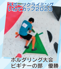
スポーツクライミング いわてカップ2023