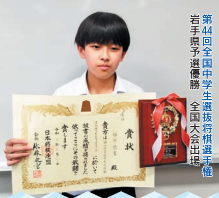
第44回全国中学生選抜将棋選手権 岩手県予選優勝 全国大会出場