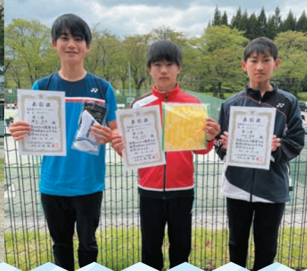
東北ジュニアテニス選手権大会 シングルス・ダブルス出場予定