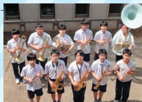
吹奏楽部 第47回全国高等学校 総合文化祭 マーチングバンド部門出場